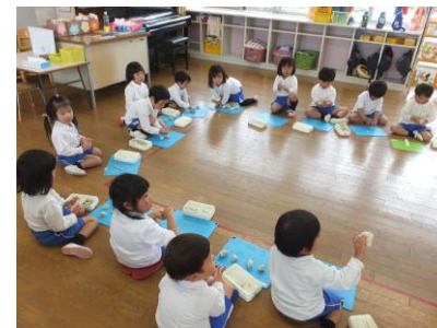
粘土遊びは、楽しいね！