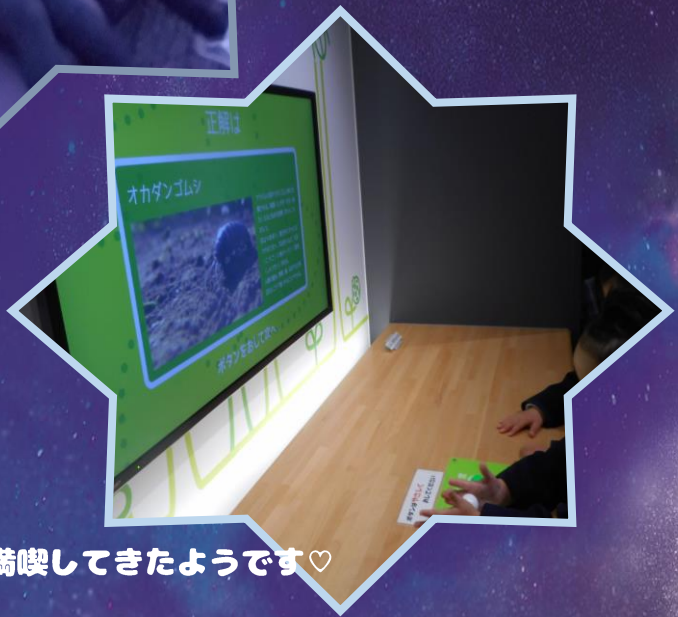
科学展示室、昆虫標本展示室も満喫してきたようです♡