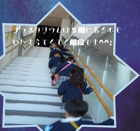
プラネタリウムは5階にあるので じつすらてくてく階段です^^;