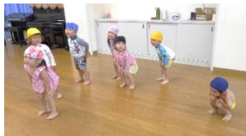
準備運動からのプール🌊