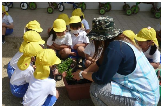
ポアチュラカとトレニアの苗を植えました★ どんな花が咲くのか興味津々です。水やりも毎日はりきっています♥

転がしドッジも大人気で昼休みにはお友達を誘って盛り上がっています！当たったら外に出る、ボールを持ったら5秒以内に転がす、どちらのボールか迷った時はじゃんけんで決める等、ルールを決めて楽しんでいます。転がしドッジを通してルールの大切さ、集団遊びの楽しさに気付いてもらえると嬉しいです(*'ω'*)