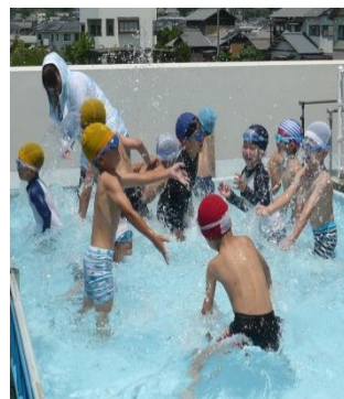
待ちに待っていたプールに おおはしゃぎです♥