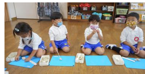
粘土遊び、大好き！今日は何を作ろうかなあ～