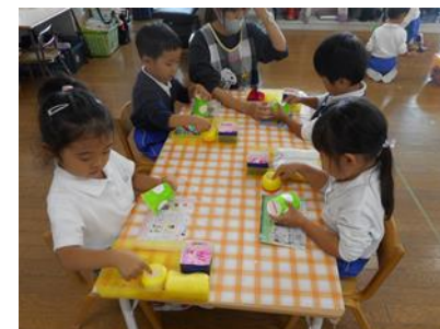
糊は人差し指にちょっとだけ～ペタペタ・・・