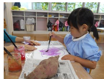
大きなさつまいも！色もそっくりに描きます。