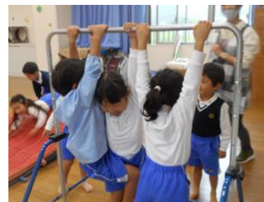
リズム室で鉄棒！誰が一番長くぶら下がるかな～