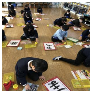
書き初め、丁寧に張り切って書きました!!