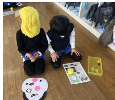
友達とペアになって福笑いをしています♥