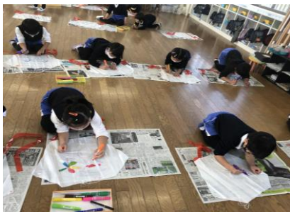
たこあげを楽しみに制作中です♪