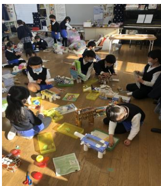
製作展の作品、どんなものができるかな?!

製作展の準備が進んできました😊個人製作はエルマーのお話の中に出てくる動物を作りました。ウサギ、トラ、ゾウ、カバ・・・いろいろな動物たちが出来上がっています♥たくさんの方材の中から好きなものを選んで「これはしっぽ!」「先生、これボンドではくっつかんよ」「それかわいいね、私も使おう!」と試行錯誤を重ねながら作っています😊 昼休みは寒さに負けず、元気いっぱい園庭を走り回る子どもたち😊なわとびや鉄棒を頑張る子がたくさんいます!卒園までに一つでも出来ることが増えてくれたら嬉しいです♥友だちと励まし、応援し合いながら頑張る姿はキラキラ輝いています🌟 卒園まであと2カ月。ステキな思い出をたくさん作って、自信を持って進学できるようサポートしていきたいと思います🌟